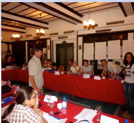
Обука за управување со проектен циклус, 19-21 јули 2011, Скопје