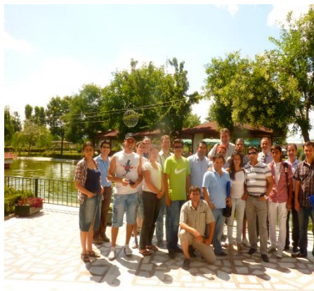
Учесници на обуката за управување со проектен циклус, 19-21 јули 2011, Скопје

Со цел навремено обезбедување на информации за планираните и спроведените активности во рамките на проектот Поддршка за имплементација на Стратегијата за Ромите, неговиот стручен тим постојано истражува, анализира, собира податоци. Оттука произлезе и овој информатор што ќе се објавува на секои четири месеци. Во првиот број се опишани реализираните активности за периодот февруари – септември, 2011 година. Сите содржини од ова и идните изданија, како и други информации за она што го работиме во интерес на поддршката за спроведување на Стратегијата и Декадата за вклучување на Ромите, ќе бидат достапни и електронски. Вие, читателите, можете да не најдете и контактирате на веб страната на проектот, на www.mtsp.gov.mk .