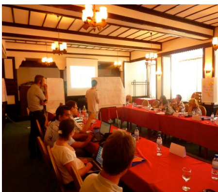
Обука за управување со проектен циклус, 19-21 јули 2011, Скопје

Сите овие беа наменети за вработените во Одделението за имплементација на Стратегијата и Декадата за Ромите (ОИСДР), Кабинетот на Министерот без ресор (МБР), и во некои од нив беа вклучени и членови на Националното координативно тело (НКТ). Од голема важност се и обуките за претставниците на локално ниво - општинските фактори и невладините организации.