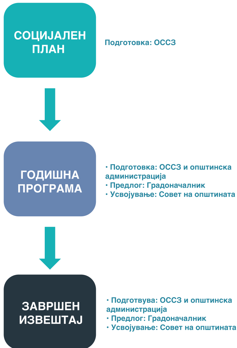
Слика 4. Процес на годишно стратешко планирање

Врз основа на социјалниот план, советот на општината на предлог на градоначалникот усвојува годишна програма за потребите на граѓаните од областа на социјалната заштита, во која се предвидуваат активности и средства за нивна реализација. Членовите на ОССЗ се активно вклучени во изработката на годишната програма, која треба да е во согласност со Националната програма за развој на социјалната заштита, донесена од Владата на Република Северна Македонија за период од 10 години. На крајот од годината се усвојува завршен извештај за реализирани активности во социјалната заштита според предвидената годишна програма, кој се доставува до Министерството за труд и социјална политика (види Слика 4).